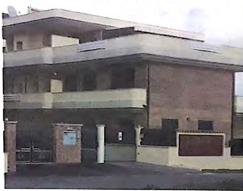
Nella foto in alto la palazzina di via delle Province. Nella foto a destra la sede della Procura di Latina