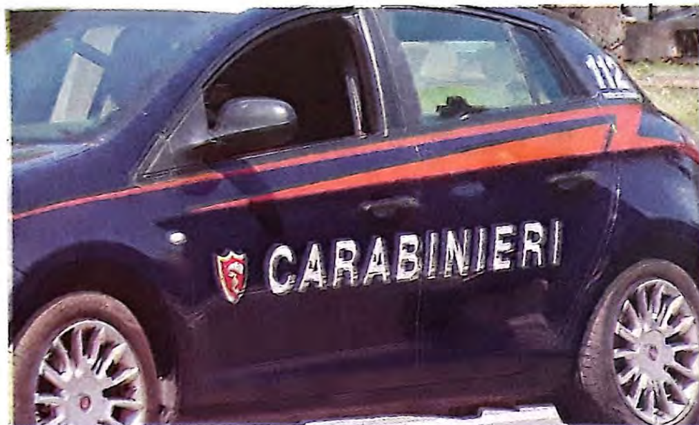
La volante dei Carabinieri